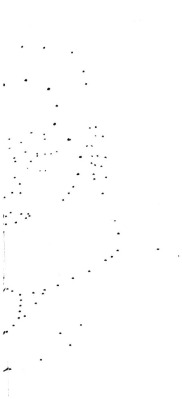
Αλεξάντερ Γκράχαμ Μπελ (Alexander Graham Bell)